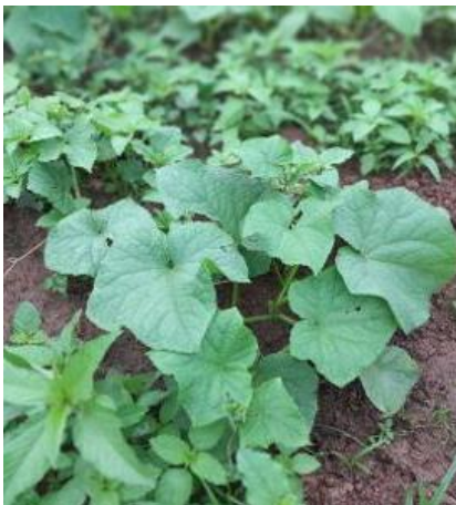
Gurken in Samsbin

Die Gartengelände sind eingezäunt, die Geräte- und Küchenhäuschen gebaut, die Organisation ist geregelt, verschiedene Schulungen haben stattgefunden und die ersten Gärten sind angelegt.