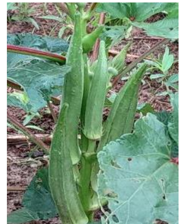
Okra in Dawelgué