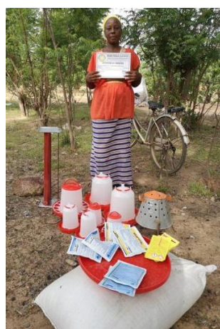
Ausbildungszertifikat & „Hühnerbedarf“