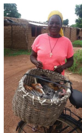
10 Hühner & 1 Hahn