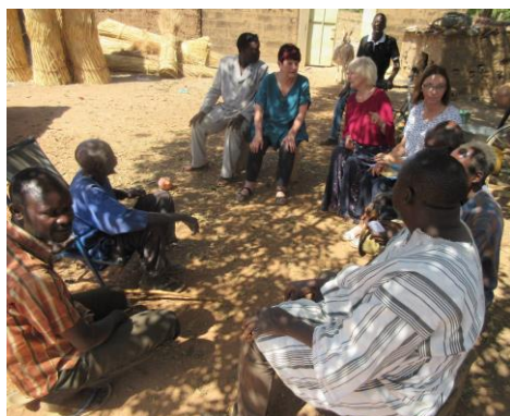
Besprechung im Dorf 2019