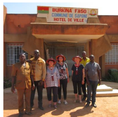
Besuch beim Bürgermeister