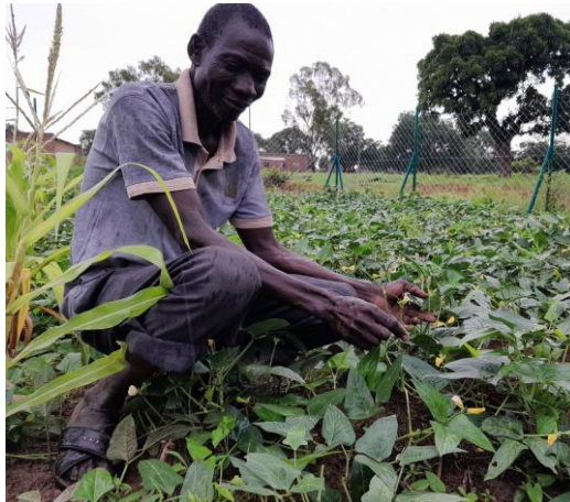
Bohnen in Saponé A